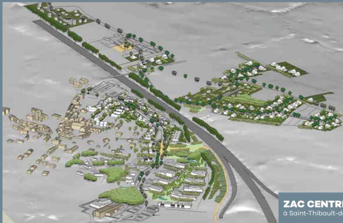
ZAC CENTRE BOURG à Saint-Thibault-des-Vignes