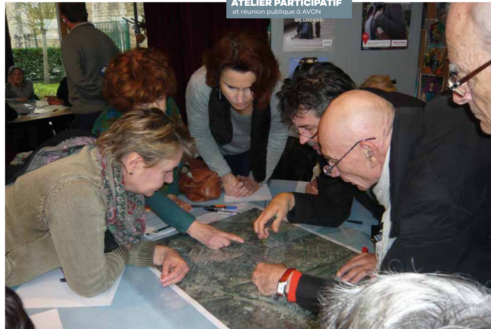
ATELIER PARTICIPATIF et réunion publique à AVON